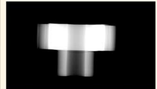
Abb. oben: Motorrotor mit Querriss

Die Aufnahmesoftware ist für die Erzeugung der digitalen Bilder verantwortlich. Die Auswertesoftware sorgt für die bestmögliche Darstellung der Aufnahmen und unterstützt die Messungen.